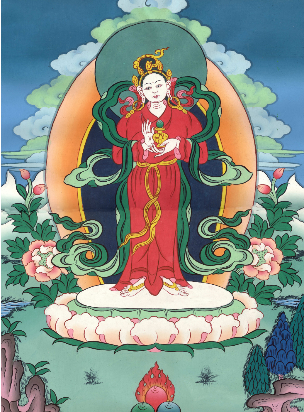
མཚོན་པའི་ལྷ་མོ།