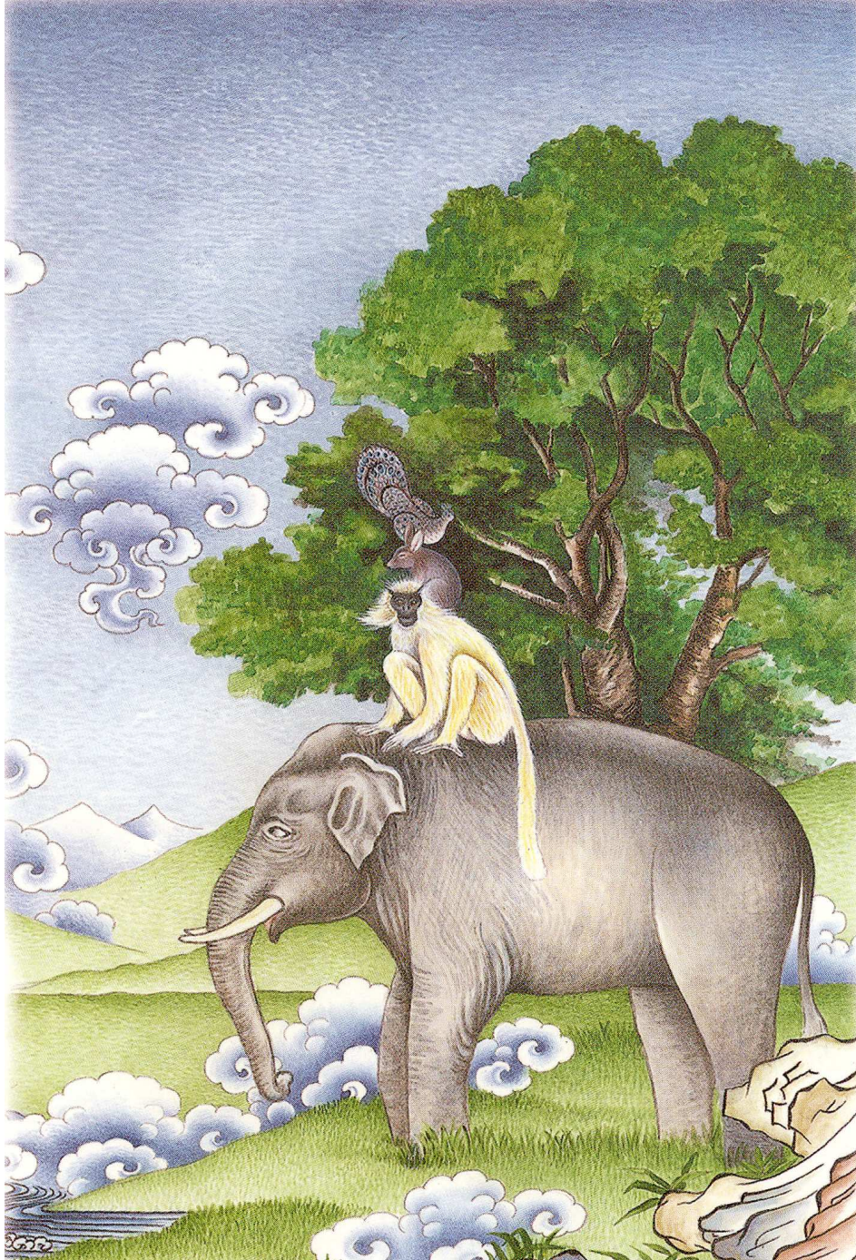
མཚུན་པ་སྤྲུན་བཞི།